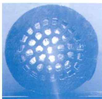
図1 爆発圧着ポーラス銅管

そのほか結城研究室では、熱と流れに関する CFD (Computational Fluid Dynamics) についても長年の経験を有しており、様々なモノづくり分野における熱問題や流動問題についても技術相談や受託研究が可能である。図2は、オリフィスとエルボを利用した新しい低コスト型の流体混合技術に関する CFD 結果である