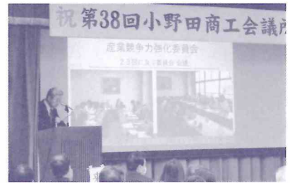
産業競争力強化委員会の報告

われた。続いて、当所地域資源活用委員会からは、同じく昨年の会員大会で採択された「小野田駅前活性化における官民学連携街づくり協議会の立ち上げ」について、産業競争力強化委員会の要望と共に、市長あて提言書を提出したと報告された。このほか、さんようおのだグルメガイド作成実行