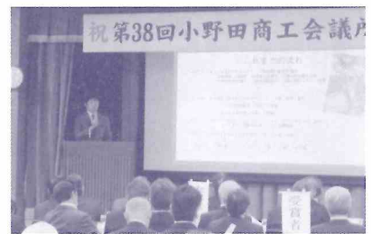
グルメガイド実行委員会からの報告

われた。続いて、当所地域資源活用委員会からは、同じく昨年の会員大会で採択された「小野田駅前活性化における官民学連携街づくり協議会の立ち上げ」について、産業競争力強化委員会の要望と共に、市長あて提言書を提出したと報告された。このほか、さんようおのだグルメガイド作成実行