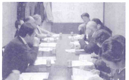
若新で開催した委員会の様子

◆地域資源活用委員会 会員大会委員会発表の内容について協議 二月八日（木）十八時